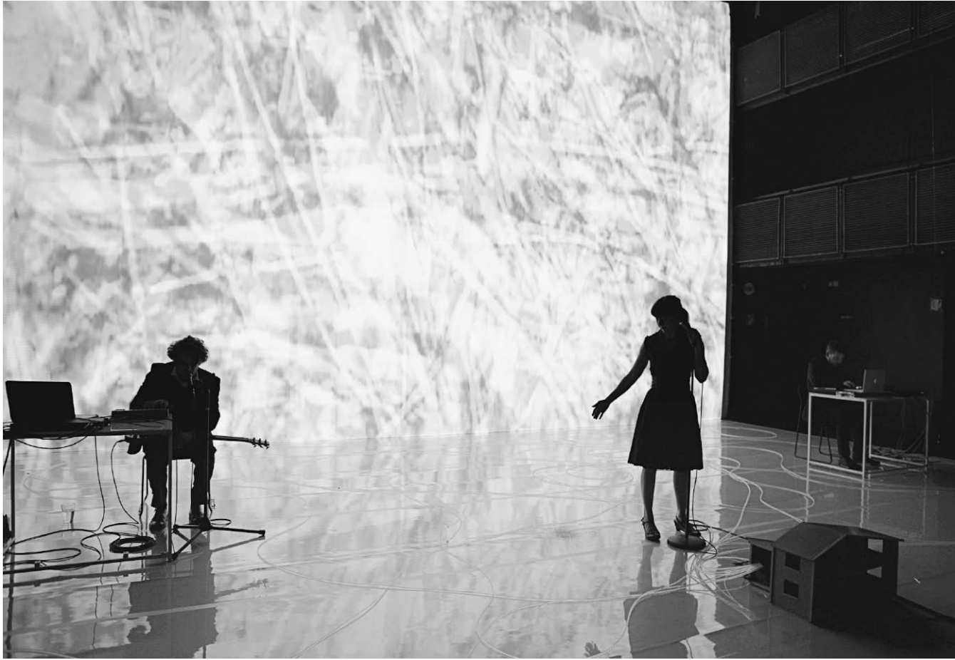
Moi qui me parle à moi-même dans le futur de Marie Brassard (Infrarouge/FTA/CNA et al., 2011).

En définitive, les petites filles de la Trilogie des dragons , convaincues qu'on peut sauver un monde de l'effacement en le nommant, sont les premières de ces archéologues du futur qui feront retour, encore et encore, dans les pièces de Marie Brassard, et qui sont les agents de l'espoir. Ces voyageurs transtemporels travaillent contre ceux qui voudraient effacer les traces, les artisans du mal, qui ne croient même pas à eux-mêmes, qu'au présent absolu. Ils saccagent la chambre construite pour survivre au naufrage du 10, Ontario. Ils se transforment en loup et avalent les petites filles qui voulaient raconter leur propre histoire, pour recracher leurs os sur la montagne des choses oubliées. Mais les efforts des naufrageurs sont vains, car il est une chambre, au revers des choses, où les temps s'entremêlent comme le sang, et il est possible, à partir de ce carrefour, de repartir dans n'importe quelle direction et de retrouver tous les chemins perdus. Ceux qui savent s'y rendre ont appris la seule leçon qui vaille : « T'auras pas peur parce que t'auras appris ce que c'est de ne pas exister. » ( La Noirceur ) ■