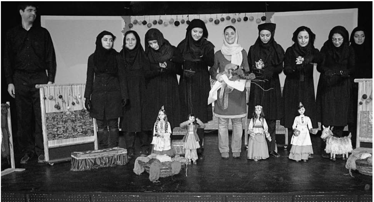
Salut des marionnettistes à l'issue d'un spectacle présenté au Festival international de théâtre Fajr, à Téhéran, en février 2011.

Par ailleurs, les comédiennes portent la plupart du temps plusieurs couches de foulards, au cas où. Le premier, apparemment obligatoire pour toutes, le foulard de base, est le maghnaëh . C'est une sorte de foulard-bonnet élastique noir qui enserre le visage, assurant que rien d'autre n'apparaîtra accidentellement pendant la représentation. Souvent, une comédienne met un foulard plus léger par-dessus ce maghnaëh . Et si elle veut montrer qu'il fait froid, elle enfle un autre foulard plus épais – ou une écharpe – par-dessus. Enfin, un éventuel chapeau se pose sur cet échafaudage et non à sa place. J'ai vu dans une pièce un personnage de prostituée italienne arborant un foulard écarlate... par-dessus son maghnaëh . Même les fillettes jouant dans une pièce pour enfants portent le foulard. (On m'a dit que ce n'était pas obligatoire jusqu'à la puberté, mais que les enfants veulent toujours imiter leurs parents.) Apparemment, seules les marionnettes féminines peuvent montrer leurs cheveux.