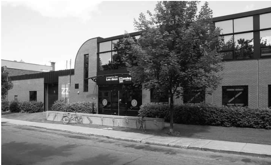
Aux Écuries.

La question lui apparaît tout autre en ce qui concerne les lieux. En principe, compte tenu des moyens qu'ils commandent et qui, pour l'essentiel, relèvent d'un financement public, ces lieux ont (ou devraient avoir) pour fonction de pérenniser une mission artistique identifiable et au service de laquelle se mettent ses dirigeants.