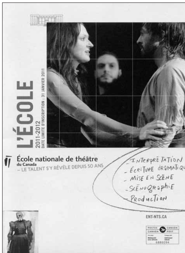
L'École nationale de théâtre du Canada fêtait ses 50 ans en 2010.

Dans l'ensemble, les conclusions du Rapport concernant les écoles francophones étaient beaucoup plus favorables que celles des écoles anglophones. En effet, sur la quarantaine d'institutions anglophones, seulement huit ont mérité la qualité de « professionnelles », alors que toutes les écoles francophones ont obtenu cette reconnaissance. Mais la vocation des cégeps était remise en question. Compte tenu de l'âge normal d'entrée au cégep, ce niveau devrait être préparatoire et non professionnel. Le Rapport proposait cependant que les programmes de théâtre des deux cégeps soient transférés dans des régions éloignées, soit au Saguenay-Lac-Saint-Jean et à Sherbrooke, pour répondre aux politiques de régionalisation prônées par le gouvernement de l'époque et pour encourager les jeunes à rester dans leur région une fois leur formation complétée. Le programme serait alors divisé en deux étapes, soit deux années préparatoires donnant accès aux écoles professionnelles et à l'université, et deux années professionnelles pour ceux qui voudraient compléter leur formation dans leur région.