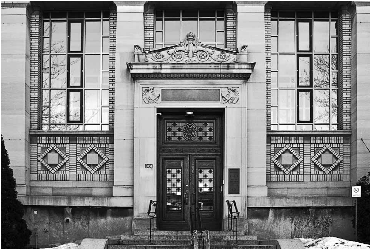
L'École nationale de théâtre du Canada. © Serge Langlois.

sans étude des besoins du milieu, reçoivent l'aval des autorités. C'est ainsi que naissent les options-théâtre des cégeps Lionel-Groulx et de Saint-Hyacinthe, ainsi que le module puis le département de théâtre de l'UQAM.