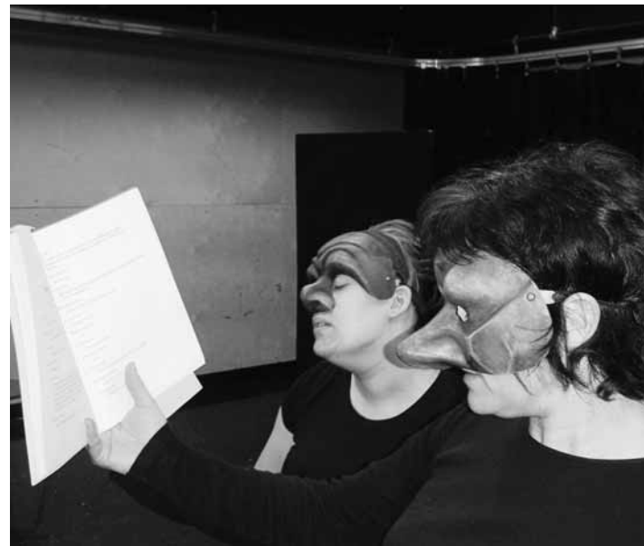
Étudiants de l'École supérieure de théâtre de l'UQAM.

À la fin des années 60, une analyse compétente et indépendante aurait conclu que le Québec francophone, avec déjà trois écoles professionnelles d'art dramatique, devrait maintenant répondre aux besoins de formation en mise en scène, de formation continue, de recherche et d'expérimentation, plutôt que de créer d'autres écoles semblables aux écoles existantes.