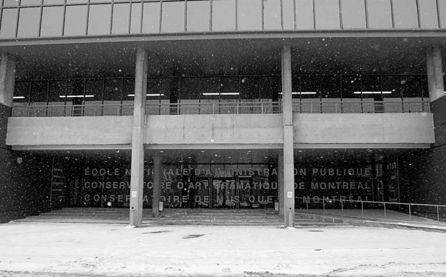
Le Conservatoire d'art dramatique de Montréal, fondé en 1954, est établi rue Henri-Julien depuis 2001.