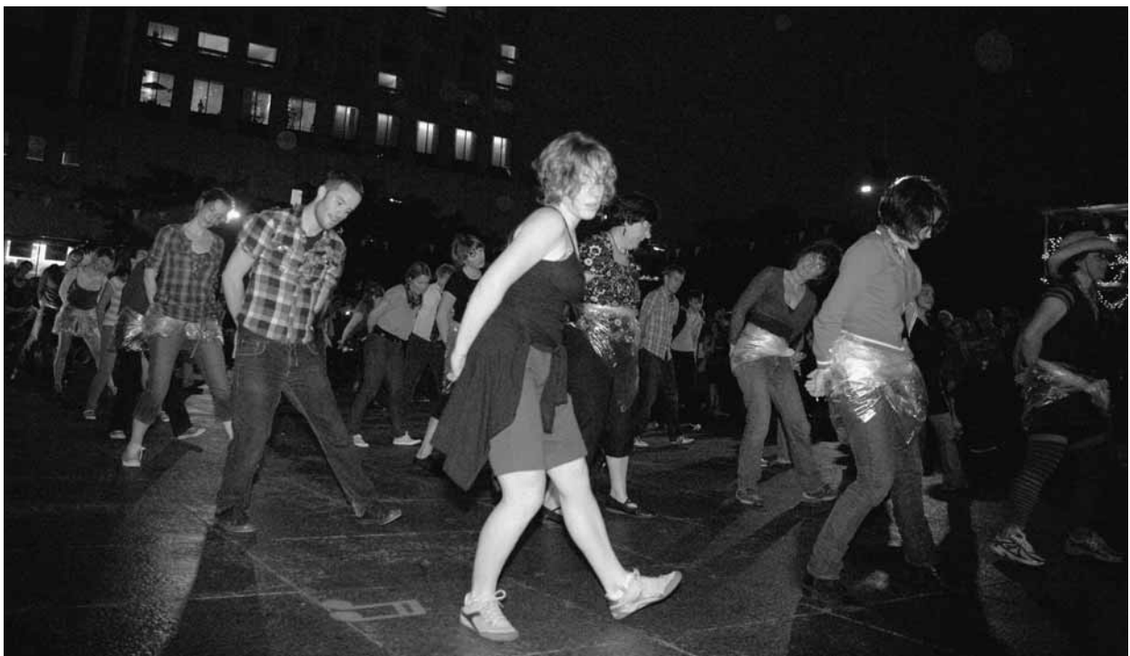
EN HAUT : Miroku de Saburo Teshigawara (Japon), présenté au FTA 2010.