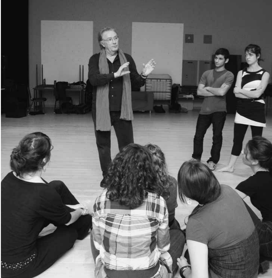
Cours d'improvisation donné par Gilbert Sicotte au Conservatoire d'art dramatique de Montréal (octobre 2010).