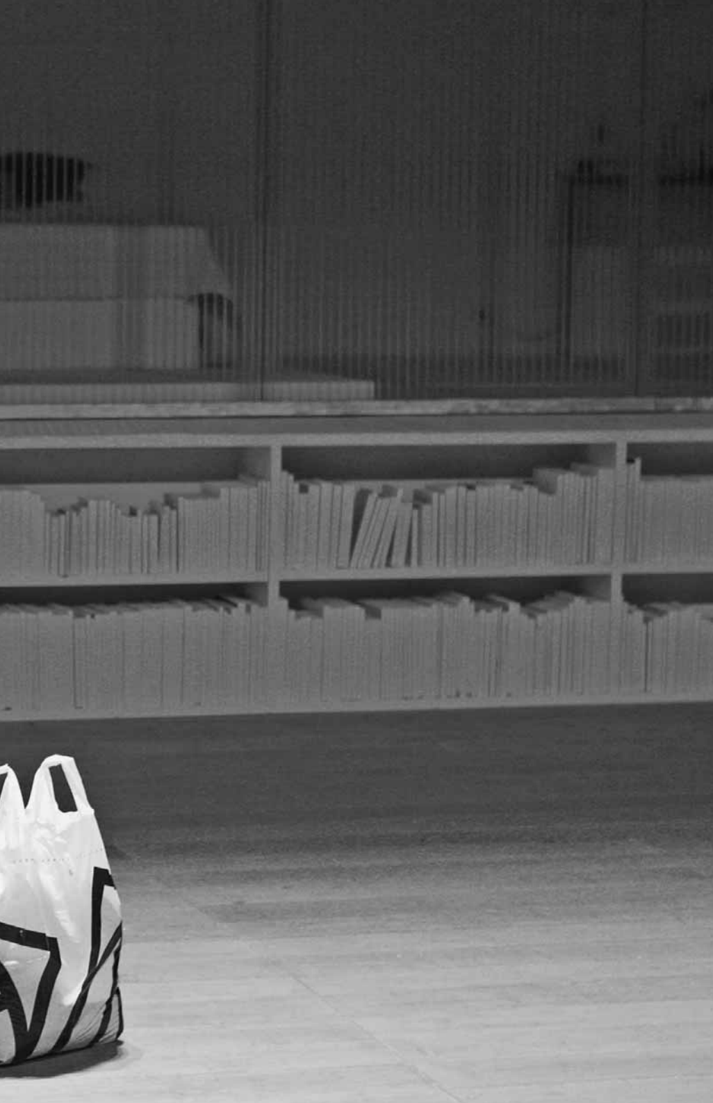
Détails de Lars Norén, mise en scène de Jean-Louis Martinelli (Théâtre des Amandiers, 2008).