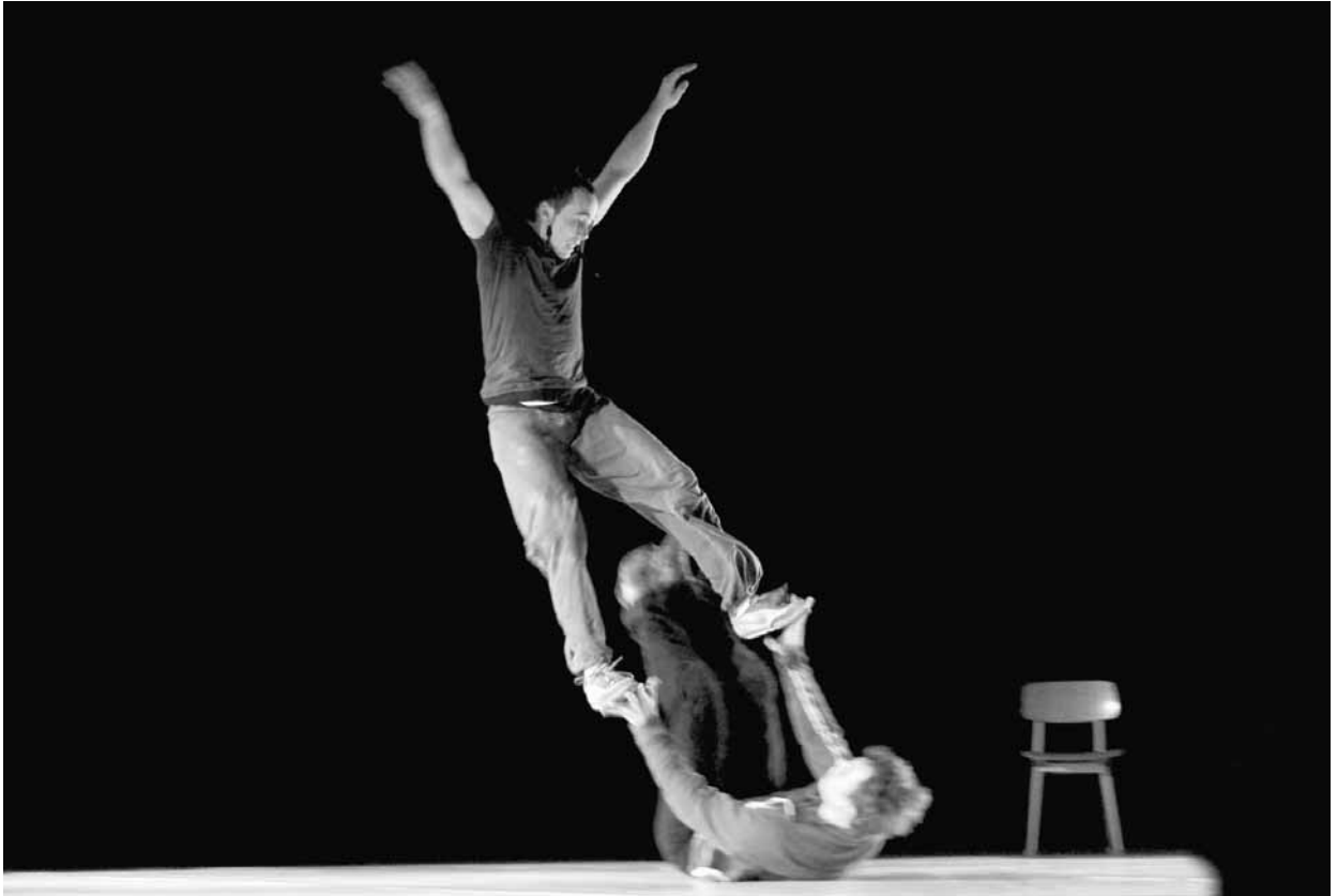
Appris par corps du duo Un loup pour l'homme, présenté à la Tohu en octobre 2009. © Antoinette Chaudron.

Les figures et mouvements qui composent ce qu'on appelle aujourd'hui le main à main sont d'origines variées et parfois anciennes. On imagine bien les portés avec des figures en souplesse ou en contorsion présents en Asie depuis des millénaires. Les pyramides et les colonnes auraient été utilisées par les Marocains pour voir l'ennemi arriver de loin et aussi lors de fêtes italiennes du XVIII e siècle où l'on rivalisait entre villages à savoir qui réaliserait la pyramide humaine la plus extraordinaire. En Occident, à la fin du XIX e siècle et au début du XX e , on parlait d'acrobates du tapis 3 , de sauteurs à terre ou de sauts en colonnes. De nos jours on voit couramment le main à main sous forme de duo, mais il arrive que des trios ou des formations plus nombreuses proposent aussi des numéros. Quant à Laissez-porter et Appris par corps , il s'agit de spectacles complets consacrés à la discipline.