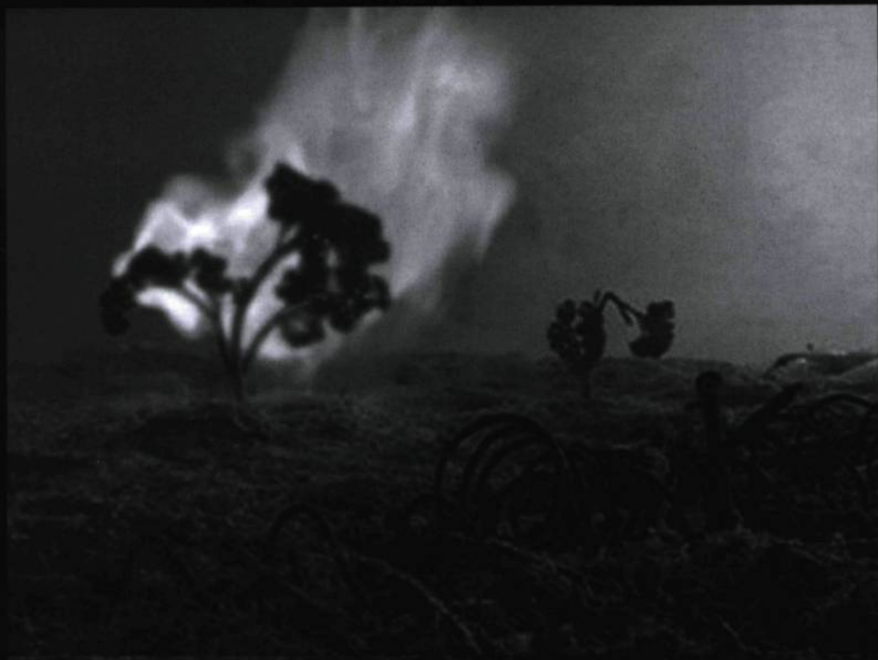
La Grande Guerre , spectacle de Hotel Modern (Pays-Bas), présenté au Carrefour 2008.