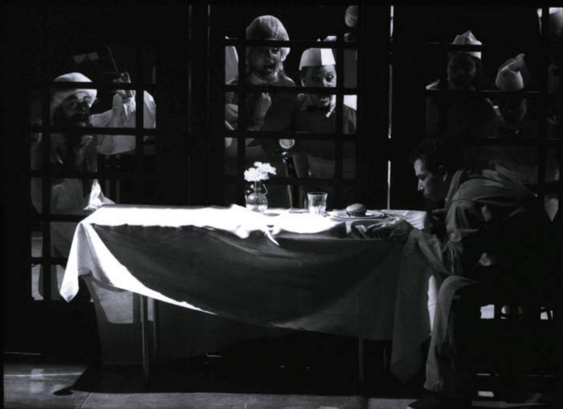
The Busker's Opera , mis en scène par Robert Lepage (Ex Machina) et présenté au Carrefour 2008.