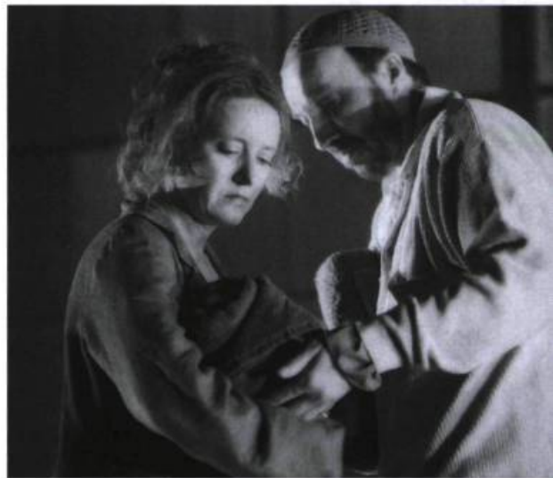
Incendies de Wajdi Mouawad (Théâtre de Quat'Sous/FTA, 2003).

On sait à quel point l'Asie a enrichi notre théâtre. C'est au tour des cultures arabes de s'imposer. À nous de les accueillir afin de bâtir une culture de la mixité qui nous sera propre. C'est dans la mesure où le Québec d'aujourd'hui se présentera comme une terre d'accueil, où sa culture s'alimentera à même celle de ses immigrants, que notre dramaturgie s'en trouvera enrichie. Et il y aura du boulot pour ces nouveaux artisans aux confessions différentes qui, sans le vouloir, bousculeront nos petites habitudes de Québécois de souche.