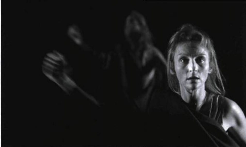
L'inattendu de Fabrice Melquiot, mis en scène par Emmanuel Demarcy-Mota (Comédie de Reims, 2002).

me parle de son parcours d'écriture qu'il envisage comme « une marche vers les hommes », il évoque « un acte d'amour, de vie » visant à affronter la mort : « Écrire une pièce, pour moi, c'est construire une petite cathédrale de papier. Contre tout ce qui en moi pourrit, alors que je suis vivant, j'érige cette chose-là », dans une adresse à l'autre dérisoire mais essentielle s'objectant à l'inévitable disparition, défiant la mort grâce à l'horizon de la rencontre. Ainsi mon acte de lecture correspond à une mise en miroir, répond au geste initié par l'auteur en réarpenant le chemin vers l'autre. « Bien lire, indique encore Steiner, c'est être lu par ce que nous lisons 3 » : la relation idéale avec le livre suppose une communion totale, une réciprocité, et elle en entraîne une autre, perles d'un collier infini, puisqu'elle vous engage, vous qui me lisez disant mon « plaisir du texte », dans une vaste chambre aux miroirs sur lesquels nos reflets se confondent. Lire, être lu, comme on échange des regards ; « dès que les regards se prennent, l'on n'est plus tout à fait deux , et il y a de la difficulté à demeurer seul 4 ».