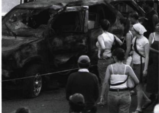
Attentat #6 , sur le boulevard Saint-Laurent, par l'Action terroriste socialement acceptable (ATSA, 2004).

La seconde stratégie adoptée par plusieurs artistes consiste à réaliser des interventions qui s'insèrent dans l'environnement social et qui questionnent les relations humaines, les rapports sociaux et leur contexte: les solidarités, les échanges affectifs et économiques, les frontières des communautés, les rapports au paysage urbain, etc. En fait, ces interventions permettent l'expérimentation d'alternatives, en ce sens qu'elles produisent des œuvres vivantes et éphémères, échappées de la réalité, ouvrant la voie à d'autres types de rapports avec les autres et l'environnement social que ceux généralement admis. Tout en ne comprenant aucun « propos » politique, ces interventions remettent en cause les cadres moraux, politiques et économiques. La définition donnée à l'activité politique par Jacques Rancière illustre bien le rôle que peut jouer cet art: « [...] qui déplace un corps du lieu qui lui était assigné ou la destination d'un lieu; qui fait voir ce qui n'avait pas lieu d'être vu, fait entendre le discours là où seul le bruit avait son lieu, fait entendre comme discours ce qui n'était entendu que comme bruit 2 . »