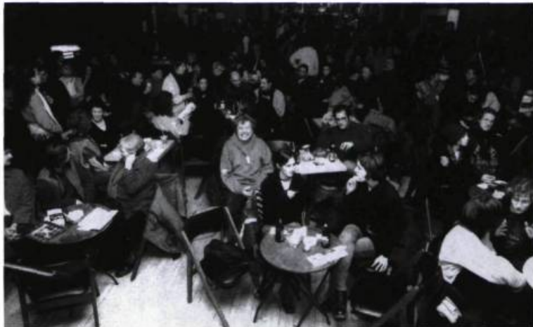
Le public rassemblé à la Sala Rossa pour le Festival Voix d'Amérique 2004.

En fait, s'il apparaît évident pour tout le monde que les poètes peuvent apprendre des comédiens quant à la façon d'aborder la scène, de livrer leur texte, de donner un peu d'eux-mêmes, je pense que les comédiens peuvent aussi apprendre des poètes. Il y a un langage particulier lié à la poésie, un langage composé d'images symboliques, bien entendu, mais aussi d'une implication physique sincère et émouvante, puisque la poésie, c'est une voix, un souffle, un rythme. De voir et d'entendre le poète sur scène nous permet souvent de pénétrer plus intimement dans son œuvre, comme si une nouvelle clef, une clef privilégiée nous était donnée. De plus, le poète symbolise, et avec raison, une certaine notion de la liberté puisque son travail est essentiellement de transgresser les normes du langage, d'ordonner différemment les images. Le poète a cette capacité de prendre ses distances avec la réalité, c'est pourquoi il est souvent isolé par une implacable lucidité. Mais il porte aussi en lui une connaissance intime de notre fragilité et de notre profonde humanité.