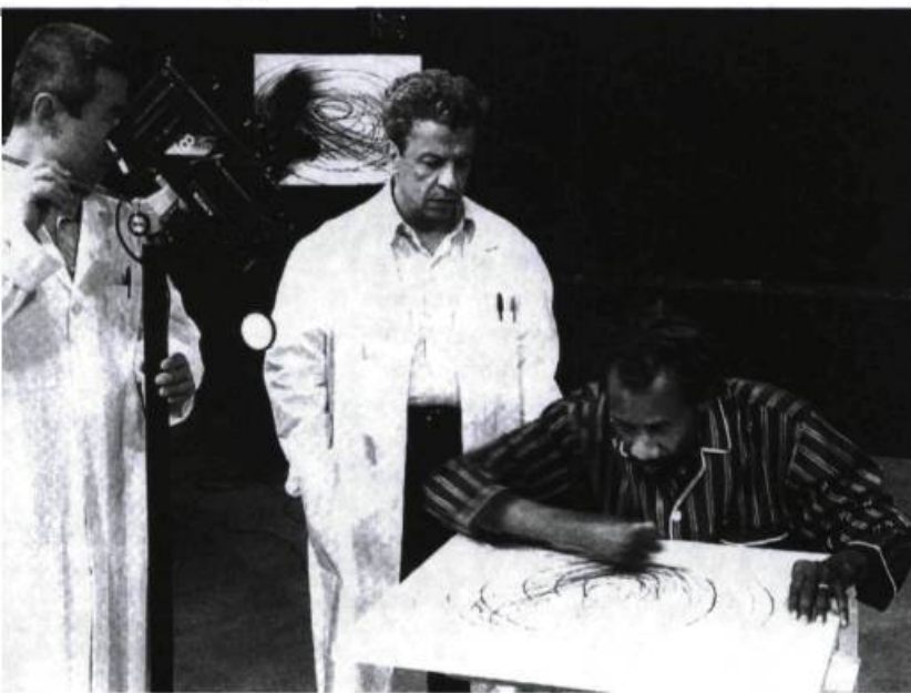
L'Homme Qui de Peter Brook (Centre International de Créations Théâtrales/Théâtre des Bouffes du Nord, 1993).

Il monte Titus Andronicus à Stratford où Laurence Olivier joue de façon mémorable. Jean Genet en avait aimé la « violence absolue [...] traduite en un langage de signes et de suggestions ». Une certaine amitié prit forme entre Genet et Brook surtout à cause de quelques antipathies communes.