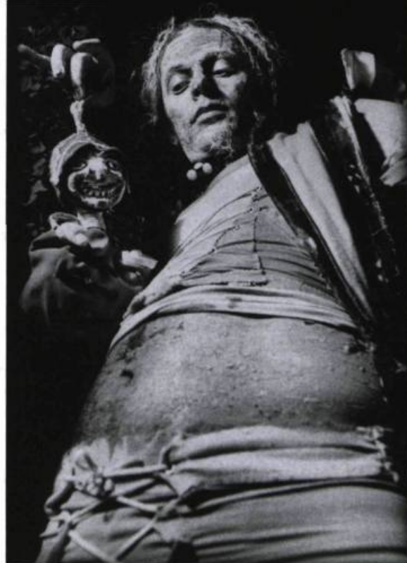
Le Pantin de bois , mis en scène par Denys Lefebvre (Tenon Mortaise, 2003).

Deux autres spectacles ont eu recours au jeu de la marionnette, en l'amalgamant à une exploration du travail gestuel. Le Heurtoir du Théâtre Incliné, mis en scène par José Babin, se définissait comme un « huis clos pour marionnette, comédiens et