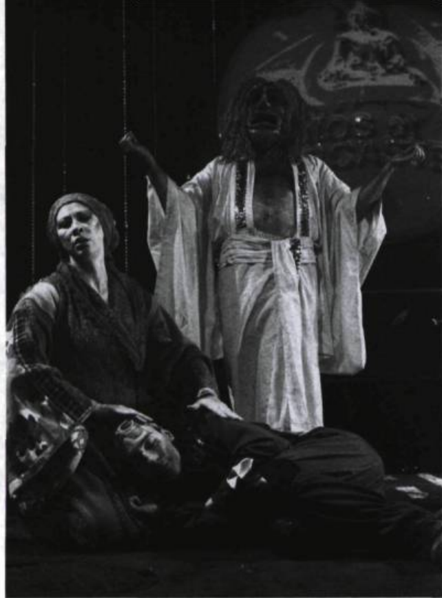
Ze Bouddha's Show , mis en scène par Pascal Contamine (Théâtre de Quat'Sous, 2003).

cette grande cage. La pièce se terminait sous une pluie d'ordures qui couvraient le sol, donnant au public un aperçu de la fin du monde provoquée par l'instinct d'autodestruction de l'homme. La construction dramatique n'était pas des plus serrée ; il s'agissait plutôt d'un spectacle s'adressant aux sens, mais qui réussissait néanmoins à éveiller notre conscience sur l'état du monde.