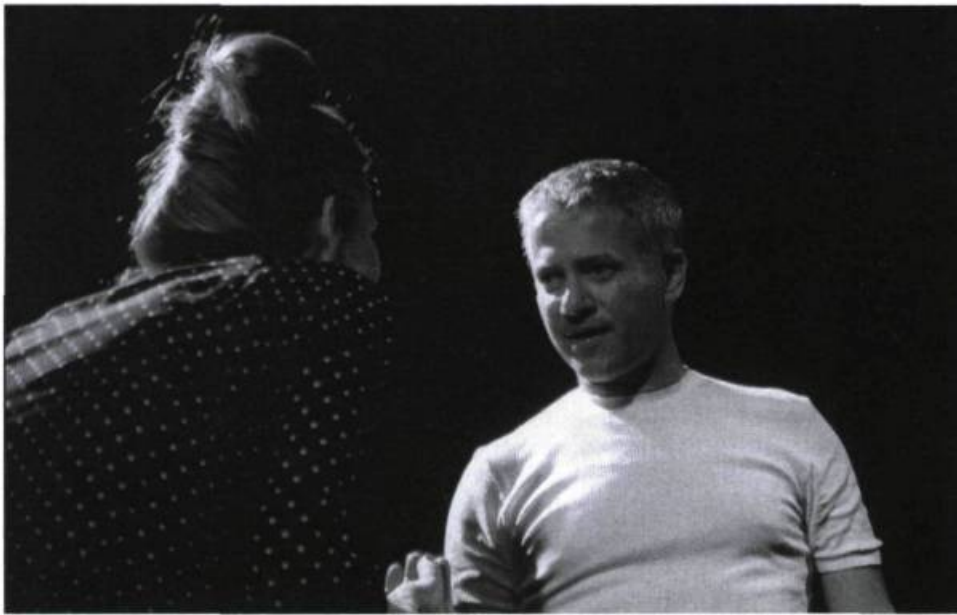
Le Collier d'Hélène de Carole Fréchette, mis en scène par Nabil El Azan et présenté au FIFL en 2002 (coproduction France, Liban, Syrie).

dans cette ville dont les chantiers masquent imparfaitement les ruines, millénaires ou trop récentes. Elle rencontre sur son chemin des êtres marqués, chacun à sa façon, par la douleur : une femme, qui délire doucement car elle n'a jamais pu faire le deuil de son enfant, un homme ayant perdu sa maison et qui veut effacer le passé, un réfugié palestinien, sans compter le jeune vendeur de colliers anciens. L'étrangère, aux prises avec un très occidental problème d'image de soi, finira par mesurer la futilité de sa quête et à faire le deuil de son collier évanescent, même s'il était une partie d'elle-même.