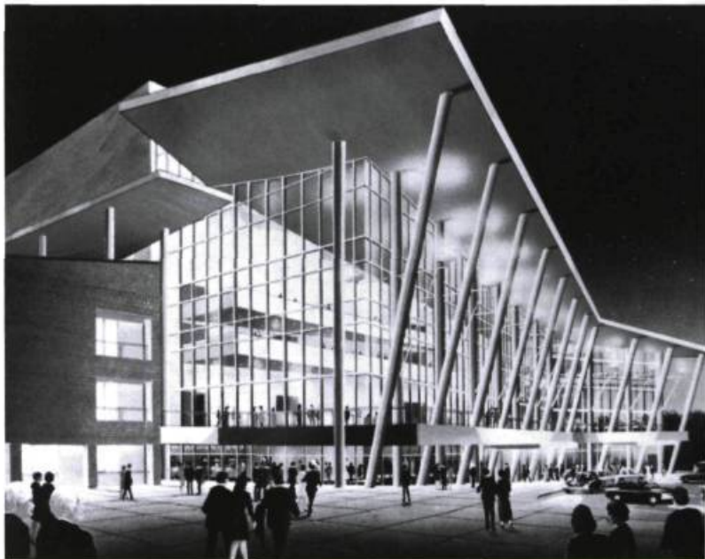
Le Hobby Center for the Performing Arts à Houston, Texas.