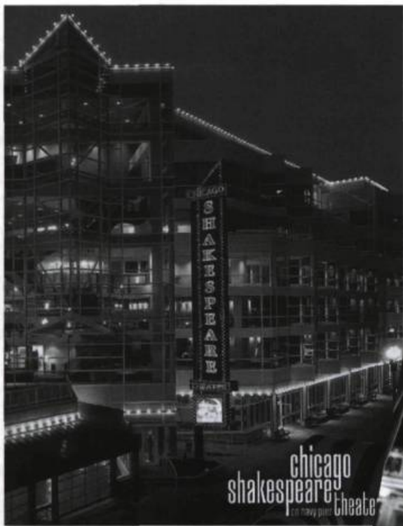
Stagebill, programme avec calendrier des spectacles distribué dans tous les théâtres de Chicago.