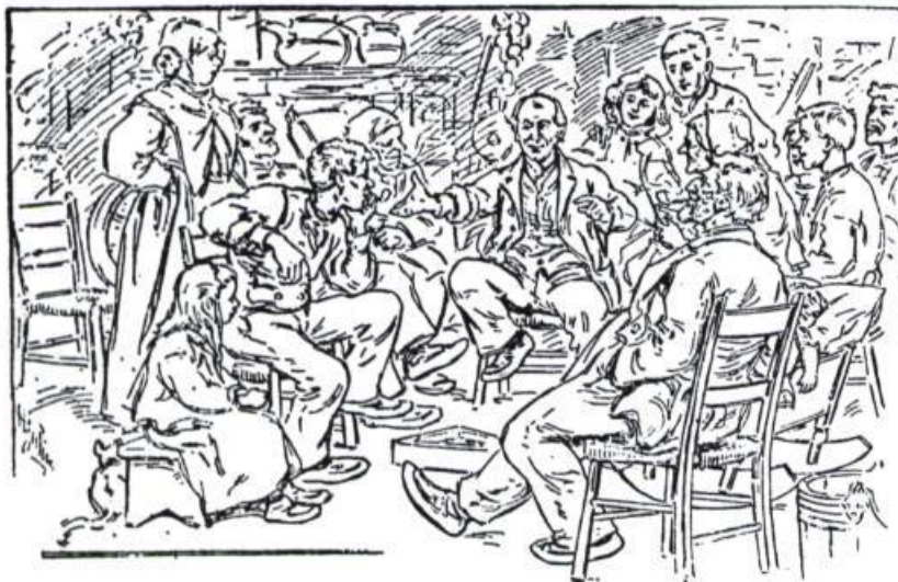
Illustration d'Henri Julien pour les Contes de Jos Violon de Louis Fréchette (Éditions L'Aurore, 1974).

d'Aphrodite – en mémoire des victimes du Minotaure errant dans le labyrinthe. La trame narrative des mythes antiques a nourri en outre la dramaturgie des premières pièces. Bref, le conte et le théâtre sont d'éternels complices, tous deux virtuoses du jeu et créateurs d'illusion.