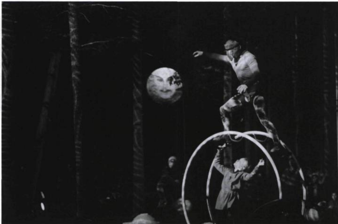
Kosmogonia (Cité de l'énergie, 2001).