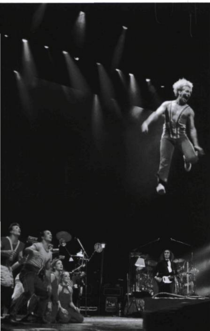
Excentricus , spectacle du Cirque Éloïze.