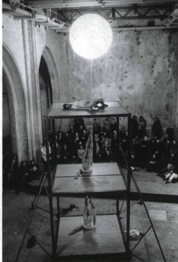
Aatt enen tionon de Boris Charmatz (France), invité au festival Danses à l'Usine.