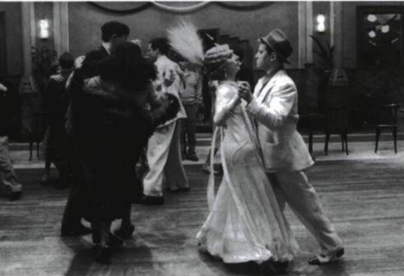
Le Bal, film d'Ettore Scola, réalisé à partir du spectacle du Théâtre du Campagnol.

Montrer la salle, vide ou peuplée, voire les coulisses, devient même une stratégie de reconstruction de la théâtralité, dans la mesure, peut-être, où la salle est la grande absente de l'histoire du cinéma. Le cinéma prend ainsi conscience de sa véritable