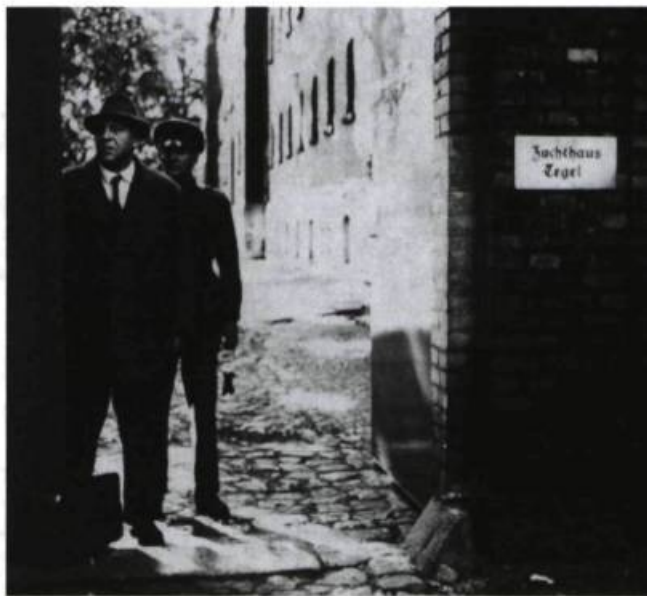
Berlin Alexanderplatz de Fassbinder.

Dans cette série comme dans les œuvres plus brèves, Fassbinder dirige ses comédiens de manière bien personnelle : le jeu, tout en étant toujours plausible, pas nécessairement naturel, n'est, en tout cas, jamais naturaliste. C'est l'esprit du film qui semble le déterminer, et l'esprit d'un film, c'est celui qui l'a rêvé, puis pensé ; qui l'a dirigé et réalisé. J