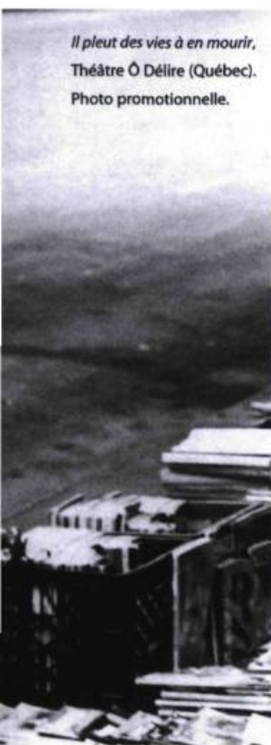
Il pleut des vies à en mourir, Théâtre Ô Délire (Québec). Photo promotionnelle.