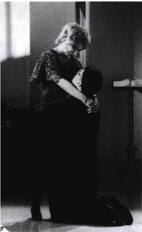
La Salle des loisirs , Théâtre d'aujourd'hui (Montréal).