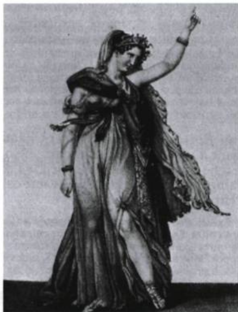
La Champmeslé (1642-1698) dans le rôle de Phèdre, qu'elle a créé. Œuvre de Prud'hon (fin XVIII e siècle).