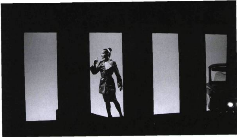
Look, de Bob Wilson, aux Galeries Lafayette.

de Robert Wilson. Ici, les décors, les éclairages, les volets qui s'abaissent et se lèvent cependant que derrière on procède à des changements rapides de modèle, tout dit la théâtralité non seulement des lieux mais des actions qui prennent place chacune dans son cadre. Les mannequins avoisinent les acteurs dans des positions sculpturales, et l'on hésite parfois à déterminer qui du mannequin ou du comédien a le plus de réalité. Comme porte d'entrée à ces diverses scènes, une forêt de bouleaux plantés en terre et portant chacun autour du tronc un vêtement différent de grand couturier. Au centre, partageant les différentes scènes, des écrans de télévision reproduisant des corps masculins ou féminins présentés en une seule image fragmentée sur plusieurs écrans paient leur tribu à Nam June Paik et à l'art vidéo.