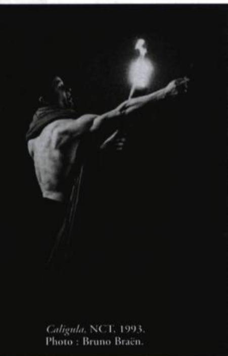
Caligula , NCT, 1993.