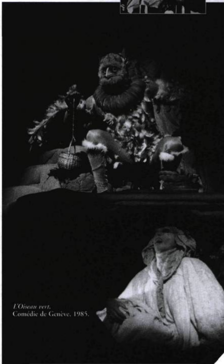
L'Oiseau vert . Comédie de Genève, 1985.