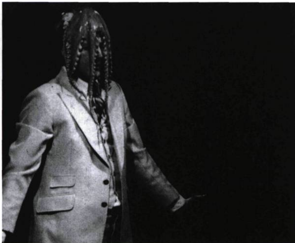
Robert Gravel avec un poulpe sur la tête dans Treize Tableaux (Nouveau Théâtre Expérimental, 1980).

étranger à son univers esthétique, où s'entrechoquaient le banal et l'outrance, dans une sauce tantôt hyperréaliste tantôt surréaliste. Comme comédien, il avait un jeu absolument unique, à mille lieues du naturalisme. Colosse tendre à la gouaille de gamin grandi trop vite, la voix grasseillante et le ton volontiers sentencieux, le pas soigneusement chancelant et le geste un rien parkinsonien, Gravel était fait pour la comédie. Son inoubliable Roi Boiteux – grand dadais en slip blanc –, ses improvisations brillantes et imaginatives à la LNI, son apparition en costume gris trois-pièces, avec un poulpe sur la tête, dans Treize Tableaux , resteront dans toutes les mémoires comme des précipités de rêves. La scène était son terrain de jeu, pourvu que l'on s'y amusât ferme.