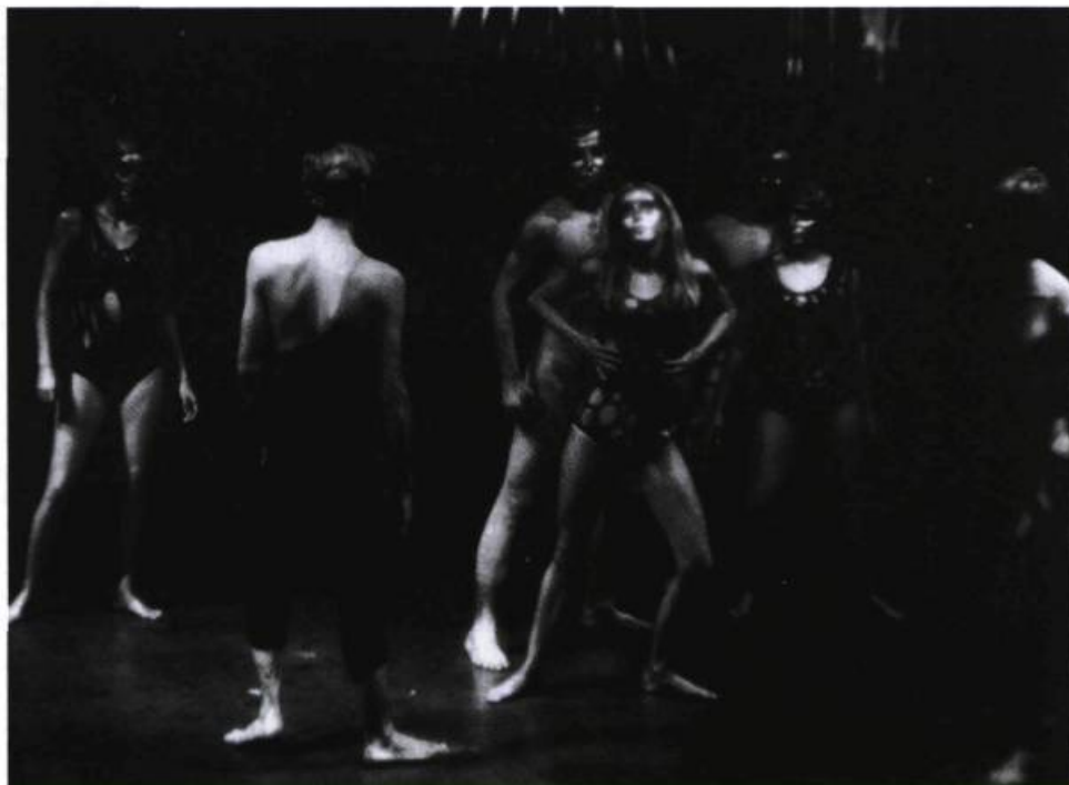
« Érotomanies », le tableau incriminé d' Équation pour un homme actuel , spectacle des Saltimbanques frappé d'interdiction en 1967.

extrêmement limités et sans rémunération pour les interprètes, chaque pièce est présentée dans des locaux de répétition du Nouveau Théâtre Expérimental les 1 er , 2 et 3 du mois à minuit moins cinq ; suit une discussion le quatrième soir pour tracer un bilan avec le public et amorcer le travail pour le mois suivant. Dès le mois de novembre, le GTEQ avait rendu publique la liste des thèmes prévus pour les douze mois de l'année (éden, barbarie, rien, avril, nudité, lâcheté, elle, minute, etc., comme un acrostiche sur é-b-r-a-n-l-e-m-e-n-t-s).