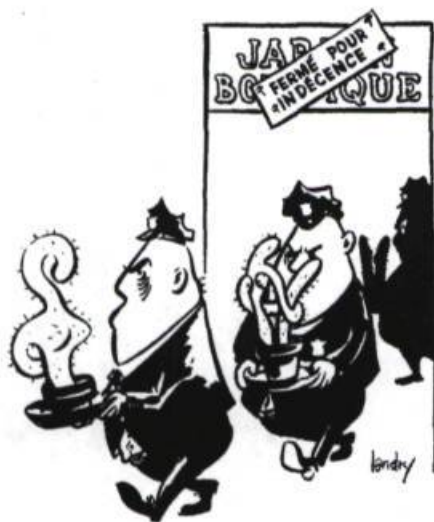
Caricature de Landry parue dans La Presse du 9 janvier 1968, le lendemain de la déclaration de Paul Buissonneau sur l'indécence de certains cactus.