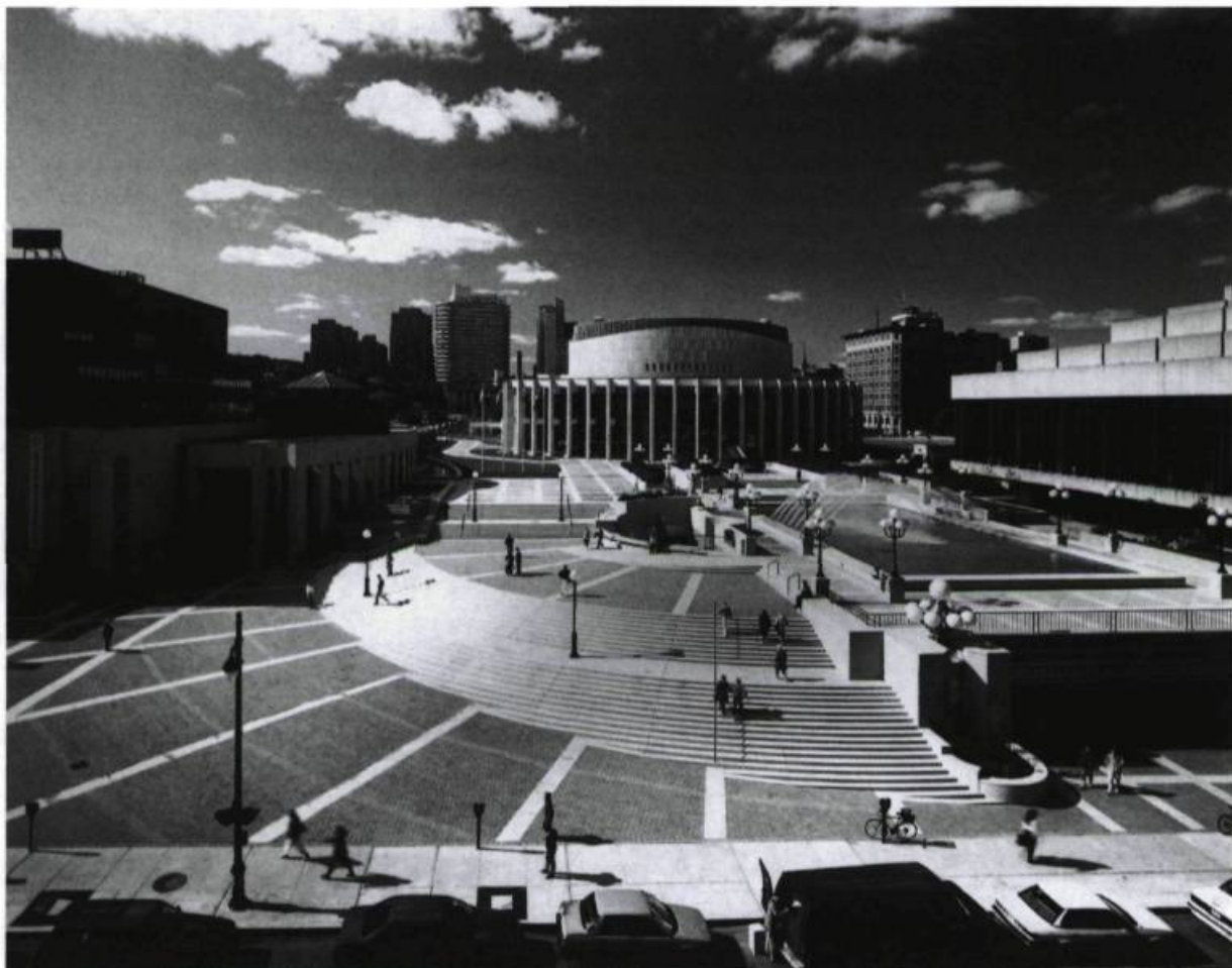
Le nouveau quadrilatère de la Place des Arts à son inauguration, en 1993.