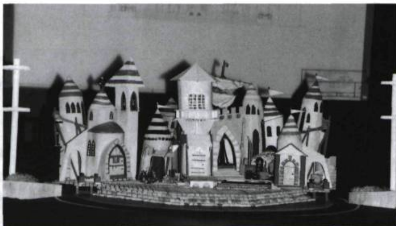
Photo 2. Le Triga d'or pour le kiosque du Brésil.