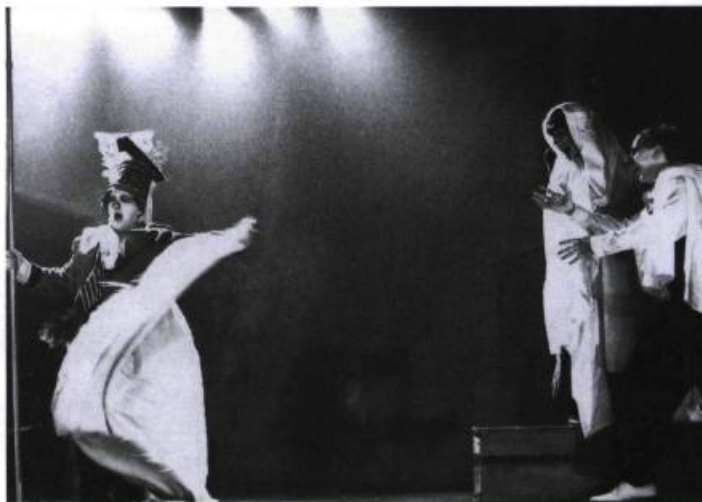
Nez à nez , Théâtre de Quat'Sous, 1992. Costumes de Maryse Bienvenu.