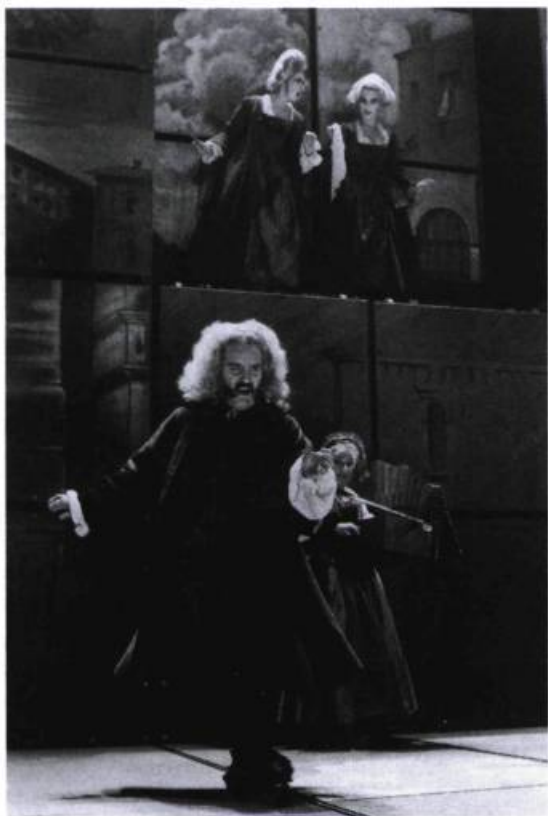
La Locandiera , TNM, 1993. Costumes de Jean-Yves Cadieux.