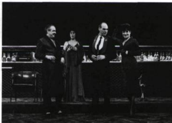
Les Beaux Dimanches , TNM, 1993. Décor de Danièle Lévesque.