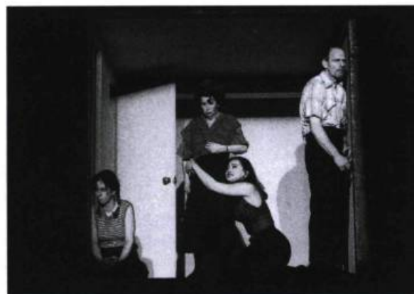
En pièces détachées , TNM, 1994. Costumes de François Aubin.