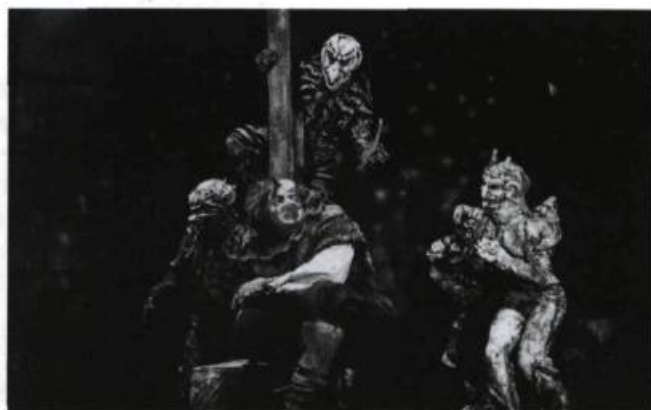
Le Bossu de Notre-Dame , CNA/Théâtre la Grosse Valise, 1993. Costumes de Mireille Vachon.