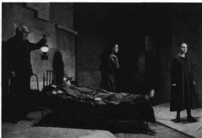
Le Malentendu , TNM, 1993. Décor de Claude Goyette.