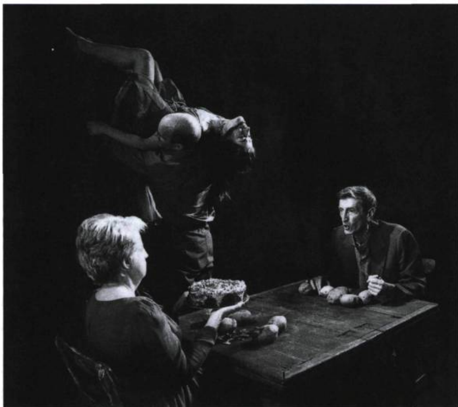
Peau, chair et os, 1991.

Les créations de Carbone 14 donnent, plus que jamais, prise sur notre temps, sur les débats qui agitent notre société, sur la démesure de notre époque qui, en écho aux rythmes endiablés et traumatiques des chorégraphies de Maheu, se perd dans une course effrénée à tenter en vain d'échapper au destin inéluctable, à la mort. ♦