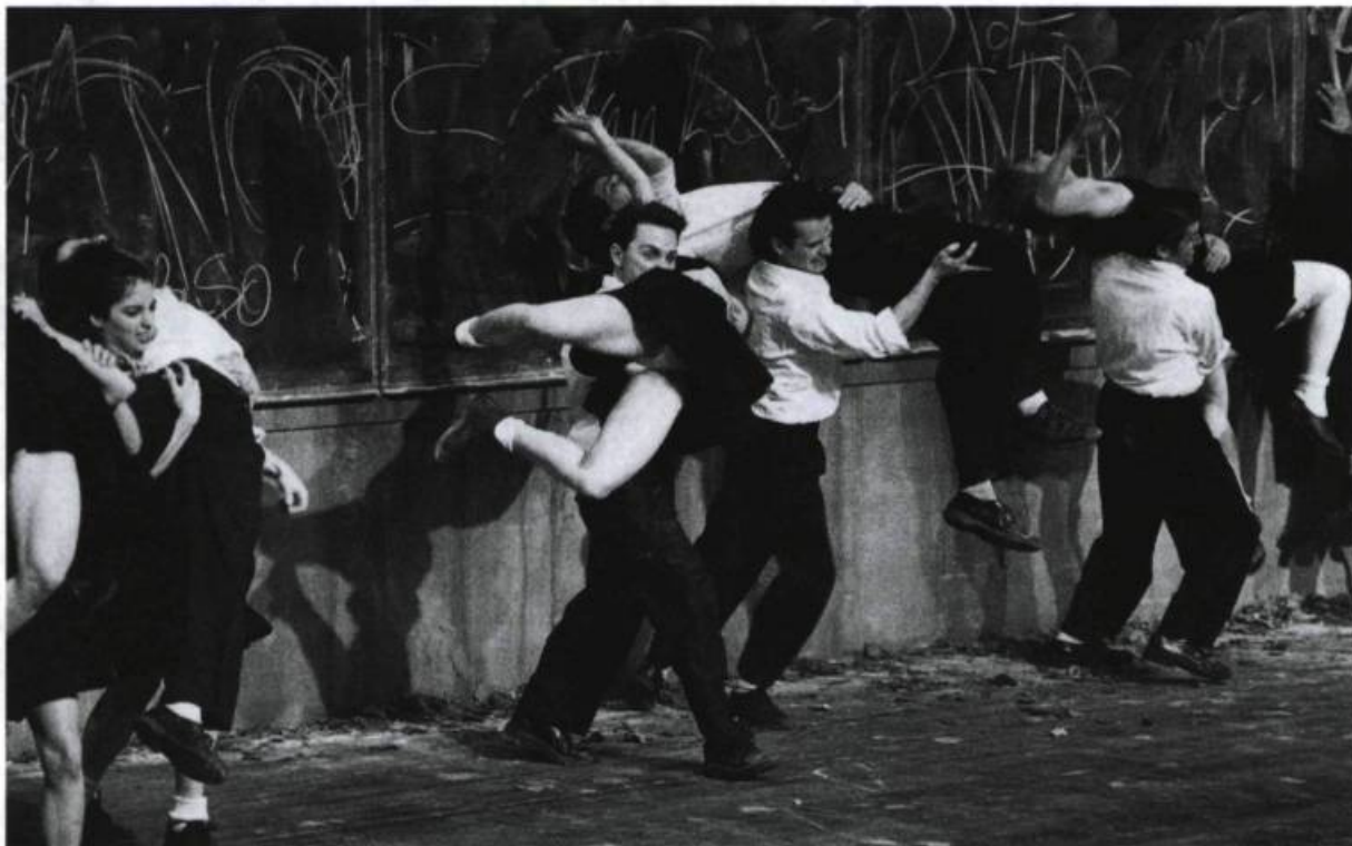
Le Dortoir , 1988.

Mémoire visuelle de ce lieu hanté par des jeunes hommes et des jeunes femmes, reflets fugitifs du temps passé, des illusions et des espoirs d'une génération perdue et d'une époque révolue, le Dortoir représente le cimetière de nos rêves et de nos certitudes, de nos passions et de nos désirs.