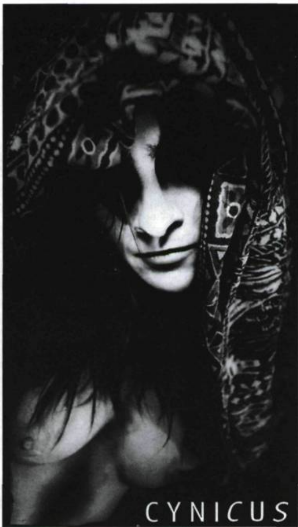
Affichette pour Cynicus . Photo et graphisme : Rolline Laporte.

lorsque nous nous unissons, c'est d'abord parce que nous apprécions les qualités chorégraphiques et les qualités d'interprétation de chacune de nous. Nous partageons les tâches inhérentes au fonctionnement de la compagnie et, par chance, nous possédons toutes des compétences particulières, qui nous permettent d'établir des bases solides.