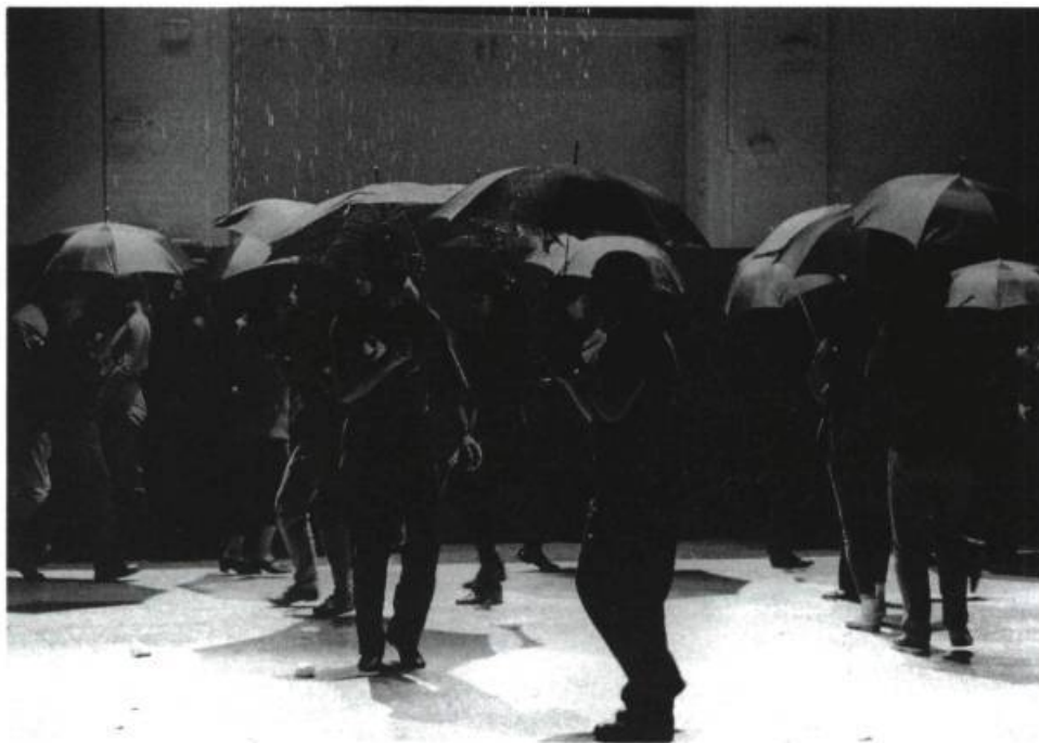
« La pluie ».