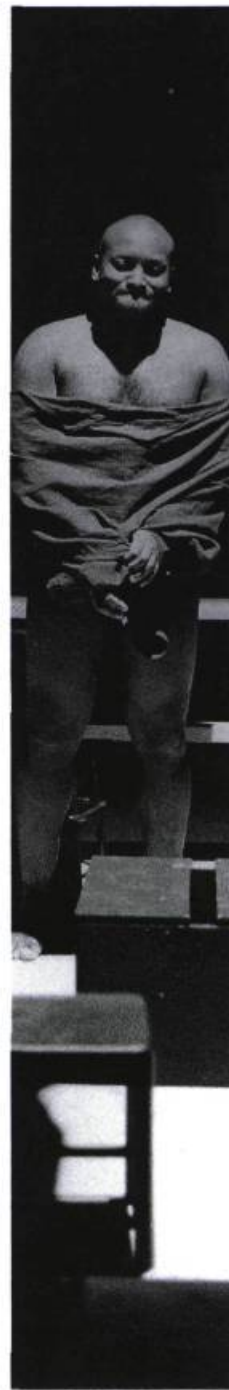
« Tout nu », Photo : Mario Viboux.