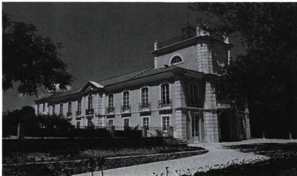
Le Museu Nacional do Teatro à Lisbonne.