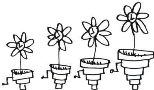
Les ludiques fleurs en pot de O Que Diz Molero . Dessin tiré du programme.

Capitale culturelle de l'Europe et, en même temps, capitale culturelle ibérique en 1994, Lisbonne a en effet accueilli l'an dernier tout ce que le monde compte comme grands noms dans les secteurs des arts du spectacle autant que des arts visuels, de la littérature et de la « réflexion ». Dans les seuls domaines du théâtre et de la danse-théâtre, on a vu défiler notamment Jorge Lavelli et le Théâtre de la Colline de Paris avec les Journalistes d'Arthur Schnitzler, Peter Handke et la Schaubühne de Berlin avec l'Époque où nous ne savions rien les uns des autres mise en scène par Jean-Luc Bondy, Pina Bausch avec pas moins de cinq pièces, Kontaktof , Café Muller/Sagração da primavera , 1980 A Piece by Pina Bausch et Viktor , Sankai Juku avec Shijima et Yuragi , ainsi que Bob Wilson ( Alice au pays des merveilles ), l'Italien Luca Ronconi, le groupe catalan la Fura dels Baus et l'Irano-américain Reza Abdoh. Le seul invité du panthéon de la mise en scène moderne à avoir dû annuler à la dernière minute sa venue à Lisbonne fut l'Allemand Peter Stein, qui devait y présenter l'Orestie d'Eschyle, rien de moins. Il paraît que les capitales européennes se bousculent aux portes pour obtenir l'épithète enviable de culturelle, avec tout le prestige et l'afflux touristique qui en découlent.