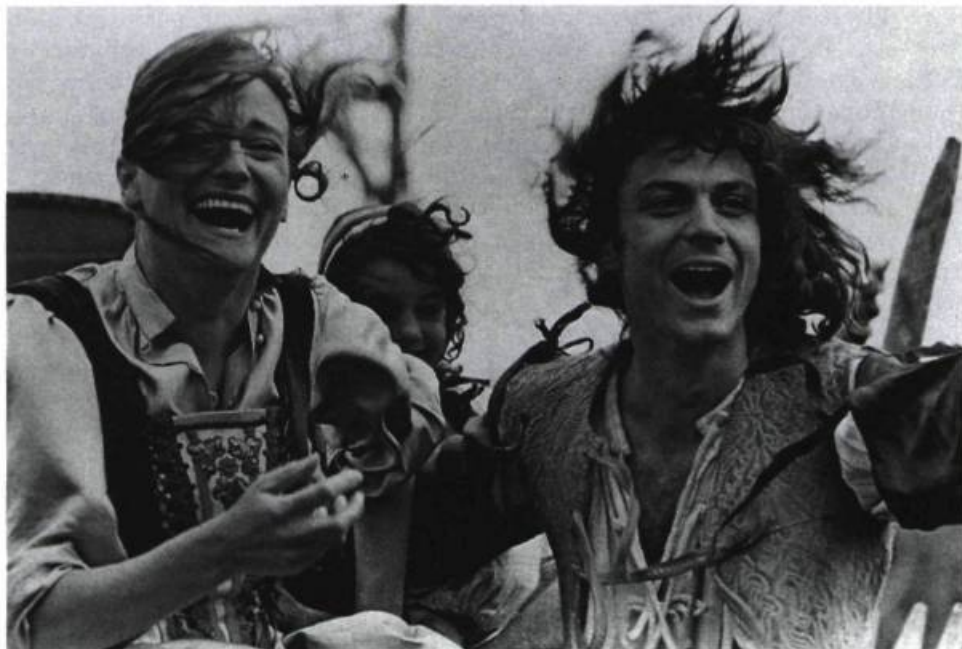
Molière, d'Ariane Mnouchkine.

humour très tarte à la crème : Michel Galabru (Monsieur Jourdain) donne dans la grosse mimique, les chorégraphies nous ramènent dans une comédie musicale américaine des années cinquante, on se lance force salades et... tartes à la crème ! Le film, qui date de 1982, semble beaucoup plus vieux que son âge : à douze ans, il en paraît trente. Sans mentir, je n'ai ri qu'une seule fois, avec Nicole qui se moque de l'habit neuf du bourgeois. C'est là qu'on comprend qu'une mise en scène molle, au cinéma, est encore plus pénible qu'au théâtre, car elle n'a pu se laisser oublier en douce et continue sa misérable existence. Que Molière reste si vivant pour nous, après trois siècles, et qu'un tel film vieillisse autant, voilà qui est affligeant.