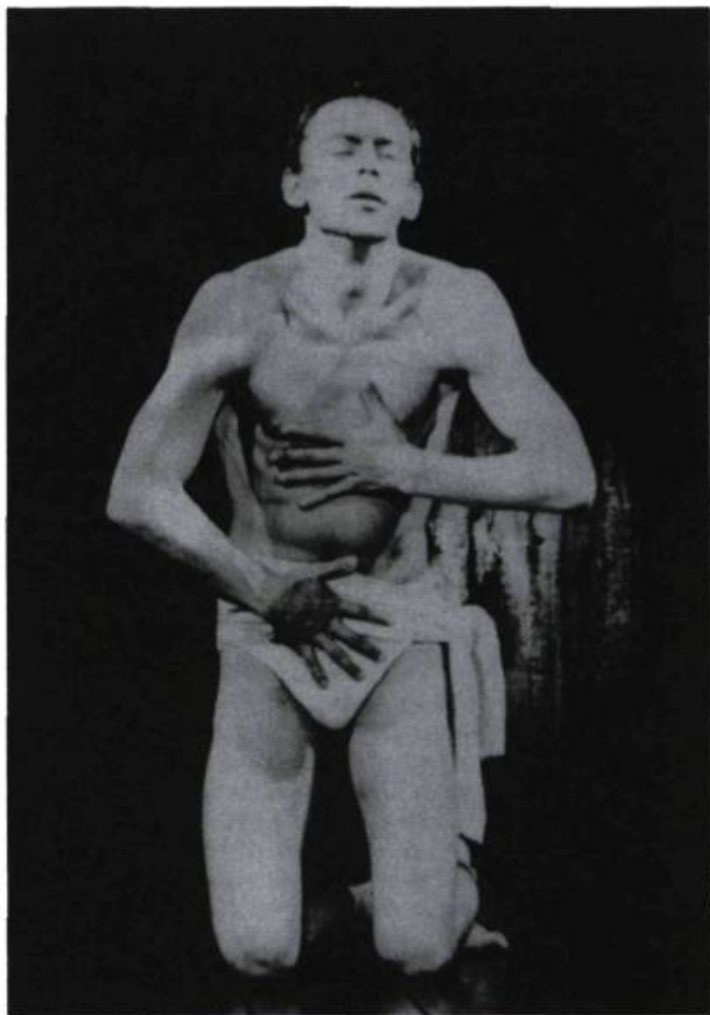
« Le corps se présente comme origine. » Ryszard Cieslak dans le Prince Constant , mis en scène par Jerzy Grotowski en 1965.

À l'époque des avant-gardes, où la situation l'emportait sur les mots , les lieux, le plus souvent, variaient, fuyaient l'autorité du centre, car rien ne semblait plus contraire à cette esthétique que l'endroit institutionnalisé, repérable, rattaché explicitement à une structure urbaine. Disons que là où le théâtre se présentait comme international, c'est le lieu qui devait apparaître comme local, marqué par l'expérience d'une collectivité et imprégné par l'histoire d'un travail. Grâce à un système de rééquilibrage dont l'art possède le secret, dès qu'il y a eu retrouvailles des mots, le théâtre a réintégré la salle à l'italienne, lieu international unanimement reconnaissable. Si d'un pays à l'autre le théâtre a privilégié ces dix dernières années les valeurs nationales de la langue, il s'est appuyé, en revanche, sur les ressources d'un lieu étranger à tout nationalisme. Le théâtre joue ainsi de ce conflit entre la vocation des mots et la nature du lieu .