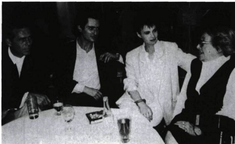
Roberto Plate, le scénographe, Sami Frey, Miou-Miou et Marguerite Duras au foyer du Rond-Point.

il s'émiette exsangue de chercher quoi écrire encore.» (p.17) L'écrivaine s'est tapie dans l'une des pièces de sa maison de Neauphle-le-Château, dans sa chambre aux armoires bleues, et elle écrit. Dès lors, seule l'accompagne la folie, indispensable, la folie qui longe toujours la solitude.