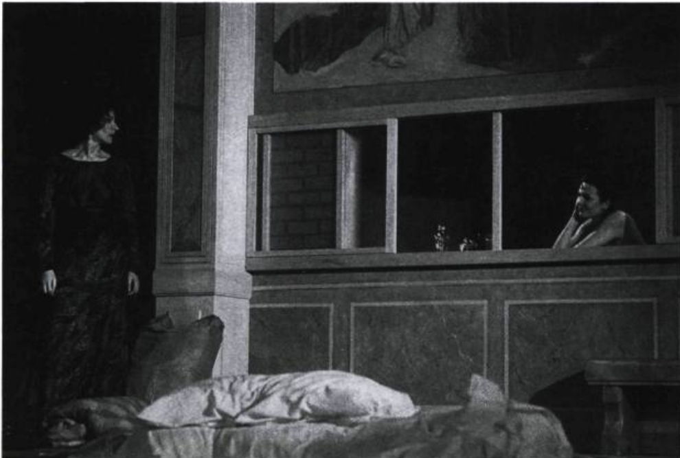
Rencontres. Texte et mise en scène : Alain Knapp; décor : E. Peduzzi.

Donc, la «stratégie» du jeu dans la création improvisée consiste à ne jamais perdre de vue que les personnages parlent d'abord d'eux-mêmes. Leur expression est la manifestation d'une sorte d'hypertrophie du moi — mais en même temps, ils sont dans l'échange car, apparemment, il y a échange entre les différents personnages. Au théâtre, l'empathie est rare, car si un personnage se voue à l'autre, s'il est véritablement dans les intérêts de l'autre, il devient passif ou alors nous avons affaire