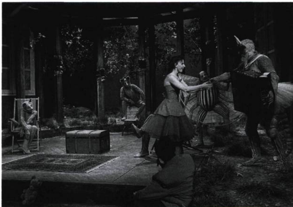
La scénographie de Danièle Bienz pour Mademoiselle Rouge de Michel Garneau, créée en 1989 à Genève, par le Théâtre Am Stram Gram, et reprise à la Maison-Théâtre en 1991. Werner Strub a créé les costumes et les masques des animaux fabuleux qui peuplaient cet univers.