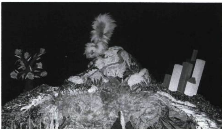
La mouffette et le rosier, marionnettes créées par Richard Lacroix pour Un autre monde du Théâtre de l'Œil.

Avant même que le spectacle ne commence, le décor, et parfois l'aménagement même de la salle, invitent à un recueillement; car il s'agit d'abord de faire apprivoiser aux enfants un lieu de spectacle et la communion avec d'autres enfants, de les entraîner dans un univers théâtral. Il y a un rituel de la représentation théâtrale auquel les enfants ne sont pas forcément habitués et qui doit être d'abord établi (souvent, un animateur viendra leur donner certaines consignes : silence à observer, applaudissements qui marquent l'appréciation, etc.). Le soin apporté à l'aspect visuel est d'autant plus important, dans les spectacles pour enfants, que ces derniers doivent être sollicités sur plus d'un plan, car leur intérêt est précaire. En outre, depuis le début des années quatre-vingt, les petits spectateurs de la génération Passe Partout, habitués aux vidéoclips et au zapping , imposent aux créateurs un défi exigeant et les placent devant un dilemme : jouer le jeu de cette hégémonie de l'image éclair 1 ou tenter de solliciter aussi le public par d'autres modes.