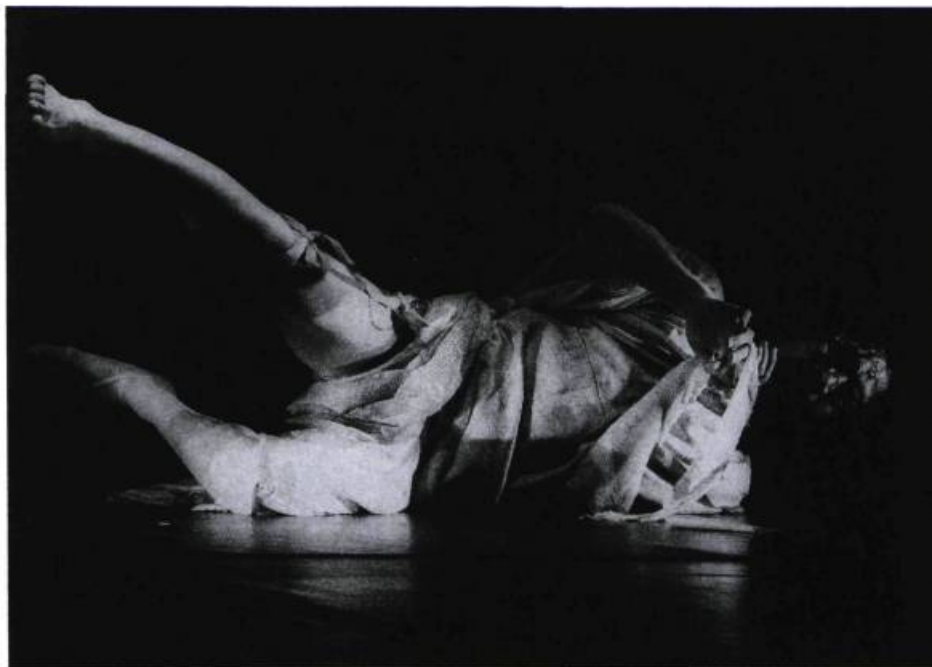
Le danseur buto Masaki Iwana.