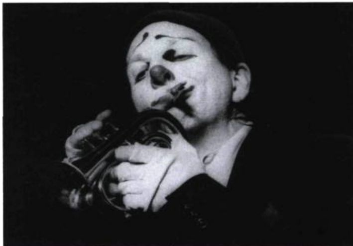
Buffo, de Howard Buten, est un personnage «tour à tour attendrissant et embarrassé, inventif et maladroit».

En voulant jouer sur tous les tableaux, Peter Bu laisse ouverts ses critères de sélection des spectacles. Il est retenu par tout ce qui bouge. Certes, son festival fait connaître les compagnies, divertit la population locale et crée un intérêt autour du mot mime. Cependant, il sert mal l'avancée de la réflexion, à cause de l'absence d'un axe de programmation. Axe qui pourrait être, par exemple, la notion de corps fictif, chère à Eugenio Barba, ou encore, plus spécifiquement, une recherche dramaturgique fondée sur le corps, puisque la définition du mot mime semble toujours aussi problématique... ●