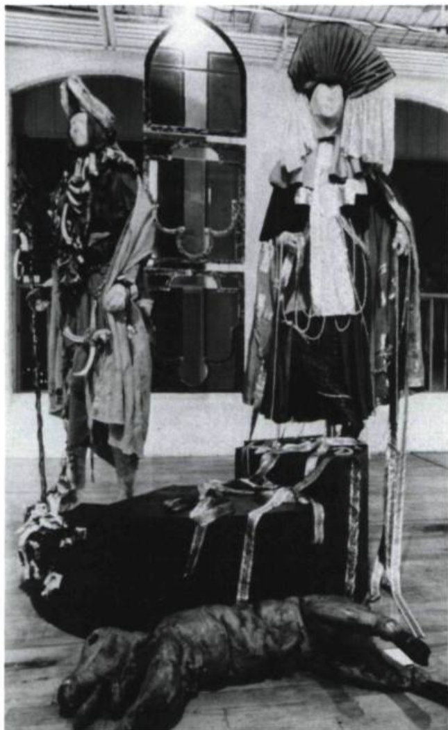
«Le costume de l'Errant, fabriqué d'os, de cuir et de jute, et comportant un couvre-chef en forme de crâne d'animal, est placé à côté de celui de la Mère supérieure, aux grands voiles vert-lime parés de longs colliers de perles.» Luxure et Sacrifice , une installation de Sylvie Boucher.

langage en soi, porteur de signes autonomes. Elle travaille à élaborer le concept de costume performatif, celui qui engendrerait un monde plutôt que d'être engendré par un contexte théâtral. Le costume, cela va de soi pour elle, est une œuvre d'art qui n'a pas besoin de justification externe.