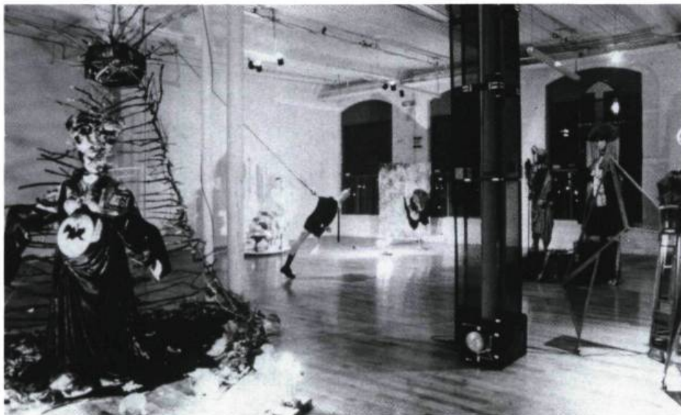
«Par la suite, vidés du support humain, ces costumes étaient exposés dans toute leur beauté matérielle, sculpturale, fantomatique, entourés d'objets ou de tableaux qui créaient autour d'eux un univers fictif, un espace autonome.»

industriel Saint-Ferdinand. Une musique électroacoustique, une «architecture sonore» selon sa conceptrice Lucie Jasmin, correspondait parfaitement à l'insolite des lieux de cette galerie profonde et spacieuse. Par la suite, vidés du support humain, ces costumes étaient exposés dans toute leur beauté matérielle, sculpturale, fantomatique, entourés d'objets ou de tableaux qui créaient autour d'eux un univers fictif, un espace autonome; chaque costume était comme le centre d'une installation.