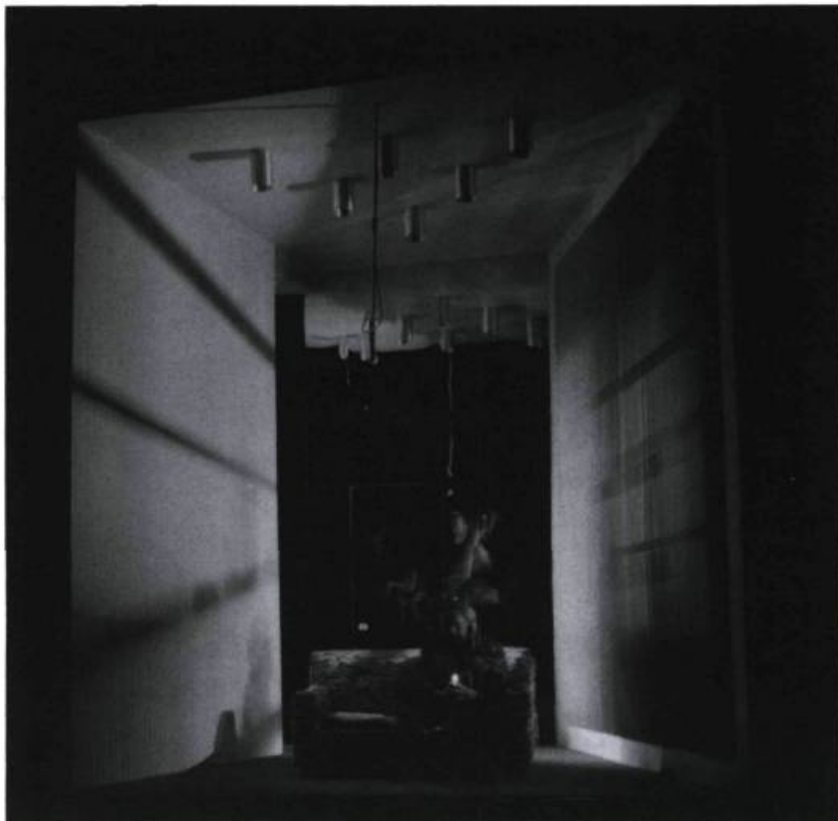
La scénographie d' Hosanna de Michel Tremblay (Théâtre de Quar'Sous, 1991). «Nous voulions un lieu réduit, mais haut, Hosanna prisonnière de sa boîte à parfum, une fenêtre qui s'ouvre sur une immense garde-robe blanche, un miroir qui nous renvoie l'image de la «dignité du cheap.»

D. L. — C'est en effet une volonté d'agir sur le jeu de l'acteur, mais peut-être encore plus d'agir sur la lecture de la pièce, de créer une image plus fantastique, qui suggère aussi une symbolique, de susciter une dynamique qui influence le mouvement de l'acteur, de la mise en scène, de la lumière. Cela pose des difficultés pour l'acteur, mais il ne s'agit pas de contraintes négatives. Les comédiens prétendent au contraire que c'est enrichissant et stimulant pour eux. Par exemple, s'ils sont dans l'eau, leurs mouvements sont considérablement ralentis; ils doivent donc adopter un autre style de jeu, et cela ne leur déplaît pas.