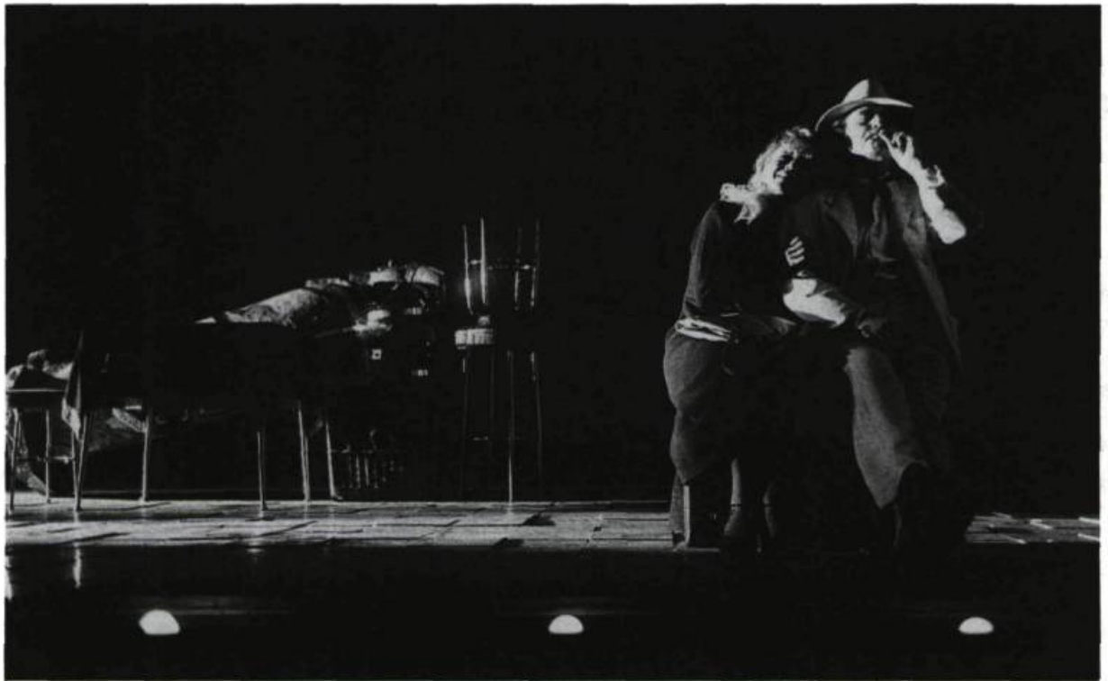
La Grande Magia d'Eduardo de Filippo. «Les rayons du soleil couchant baignaient la scène dans une lumière rasante aux tons chauds.»