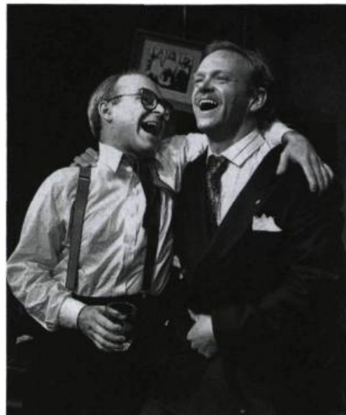
«Des êtres privés de droits sociaux, se battant à la fois contre les agents du Pouvoir et le Destin», dans Love and Anger de George F. Walker (Factory Theatre).

George F. Walker (né en 1947), qui est peut-être l'auteur canadien le plus connu, chez lui comme à l'étranger, fait le pont entre les années 1970 et 1980; encore que dans la présente décennie, son écriture soit plus forte que jamais. Selon la légende, Walker serait devenu auteur dramatique en