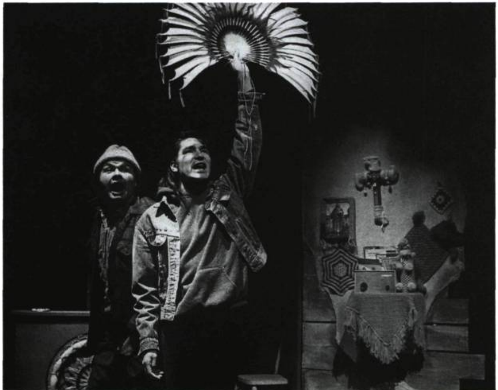
Dry Lips Oughta Move to Kapuskasing du Manitobain et Indien cri Tomson Highway «conjugue affectueusement des personnages autochtones truculents et amusants avec le royaume spirituel du filou indigène Nanabush». Une production du Théâtre Passe Muraille de Toronto.