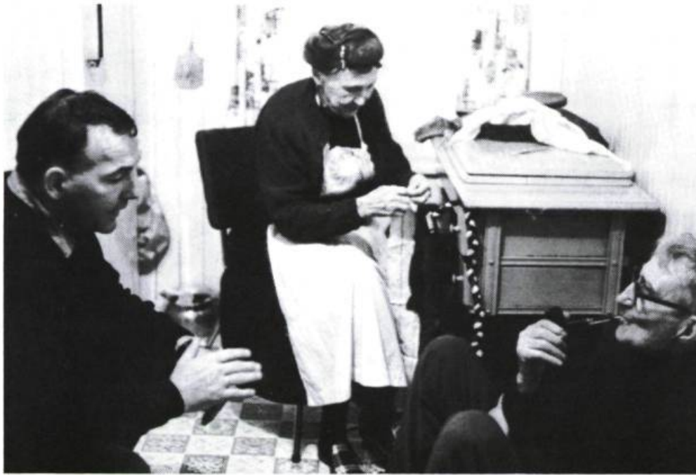
«La langue française parlée est riche et variée partout en francophonie.» Photo tirée du film Le Règne du jour de Pierre Perreault, qui «nous a permis d'entendre [...] le savoureux parler de l'Île-aux-Coudres».

On en a descendu deux; mais alors on s'est arrêtés parce que les balles qui passaient à côté ricochaient par terre et sur les rochers, elles partaient en sifflant dans la campagne. Comme au bout des prés il y avait des arbres au bord d'un ruisseau, avec une maison, on ne voulait pas s'attirer des ennuis avec les balles perdues qui auraient pu toucher l'habitation 9 .