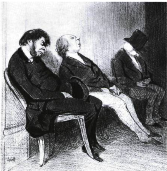
Académiciens travaillant au dictionnaire. Caricature d'Honoré Daumier, B.N. Estampes , tirée de l'Académie française de Pierre Gaxotte, Paris, Hachette, 1965, p.60.

Signalons, d'ailleurs, que cette situation n'est pas unique à la francophonie. Elle se retrouve dans presque tous les pays du monde où une société fortement hiérarchisée a permis aux lettrés de vivre en marge du peuple et d'élaborer une langue à part estimée supérieure à celle du commun. On la