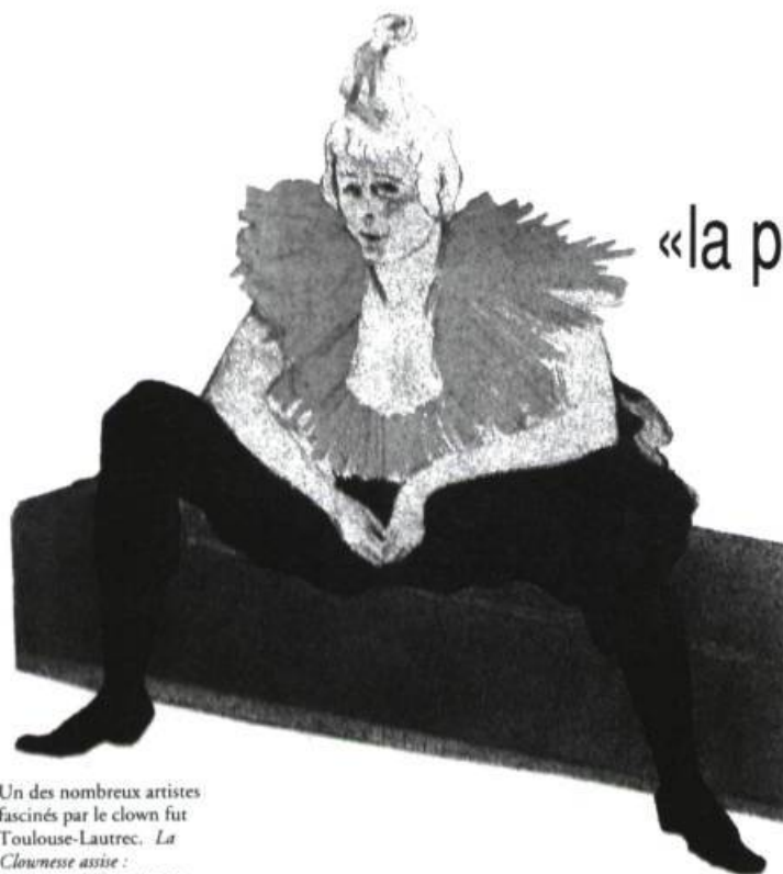
Un des nombreux artistes fascinés par le clown fut Toulouse-Lautrec. La Clownesse assise : mademoiselle Cha-U-Kao (Albi, musée Toulouse-Lautrec). Reproduction tirée de la Planète des clowns d'Alfred Simon, Lyon, La Manufacture, 1988, p. 155.