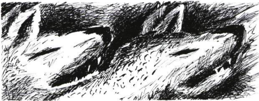
Illustration : Jean-François Bélisle.