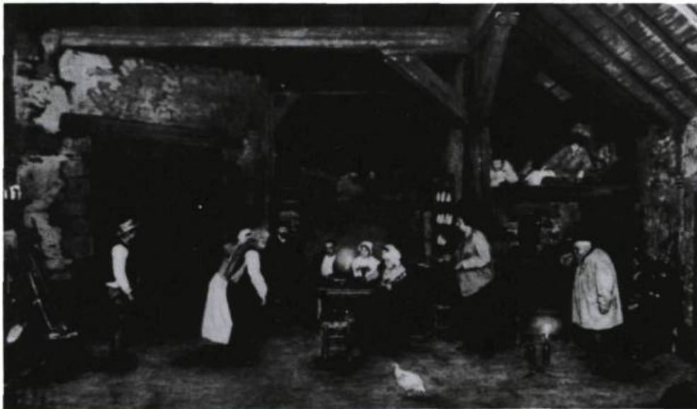
La Terre , d'après Zola, au Théâtre-Antoine, 1902. L'illusion du réel à son paroxysme.

La mémoire est infinie de ce que le sujet qui en est le dépositaire se constitue dans son incessante avancée. La mémoire n'est pas qu'une passive banque de données, elle est un lieu dynamique qui renvoie à une conscience ouverte à l'irruption de l'inconnu: ainsi, la tâche de l'acteur consiste moins à mémoriser des répliques et une mise en place qu'à faire advenir dans l'instant de sa présence une certaine vibration de l'être qui le pousse à se souvenir comme malgré lui . Là est la