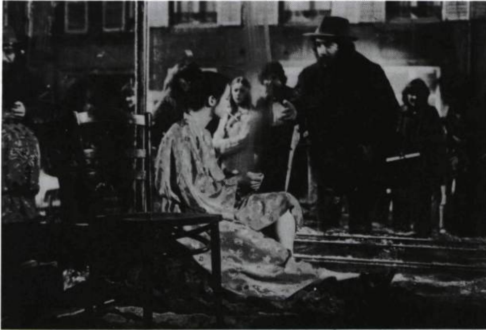
L'action des deux côtés de la vitre, où les passants deviennent spectateurs et inversement : Pig, Child, Fire , du Squat Theater, troupe d'exilés hongrois établie à New York.

à son secours. Les deux hommes disparaissent. La femme l'emmène dans une impasse. Là, en l'espace de quelques minutes, se déroule un spectacle qui provoque l'expérience la plus émouvante que le héros ait jamais vécue. Le reste de sa vie sera marqué par cette rencontre.