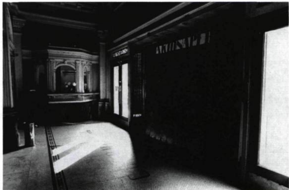
Le hall d'entrée du Théâtre Corona, construit en 1913 et décoré par Emmanuel Briffa.

C'est l'été, l'après-midi est doux et, à l'intérieur du vieux Théâtre Corona, une brise légère fait voler l'antique rideau de scène, tandis que le foyer lui-même est baigné de soleil. Sur le parterre sans sièges, étrangement vaste, des gens marchent, lèvent leurs regards jusqu'aux hauteurs vertigineuses des balcons et du toit. L'événement qui rassemble ces curieux se situe entre l'expo-