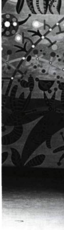
Feste, le bouffon d'Olivia.